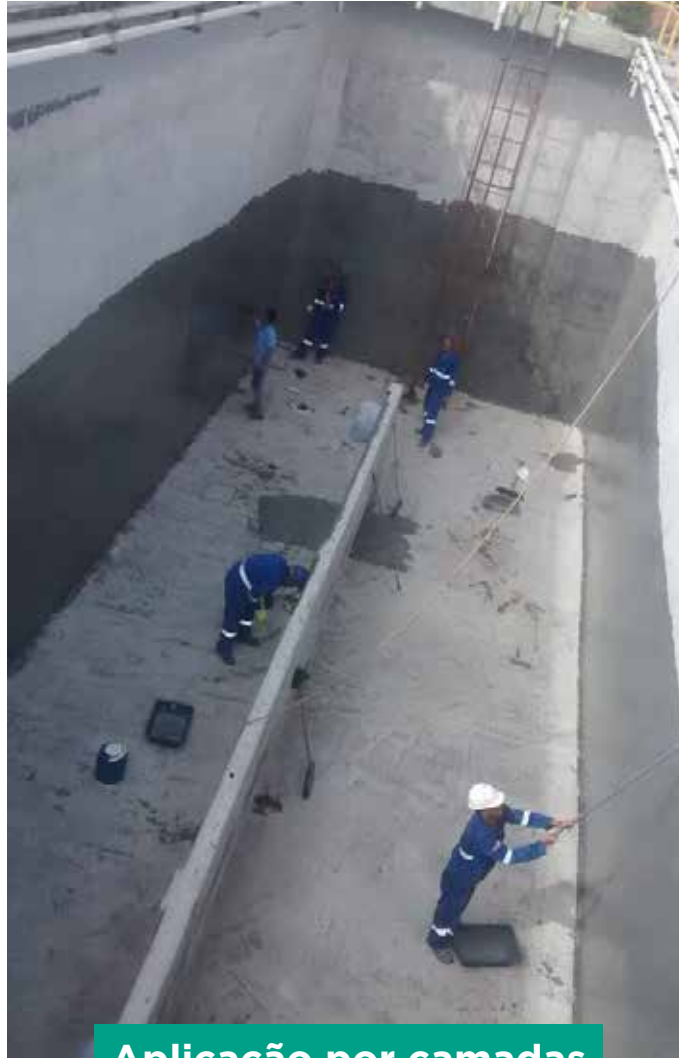
Aplicação por camadas