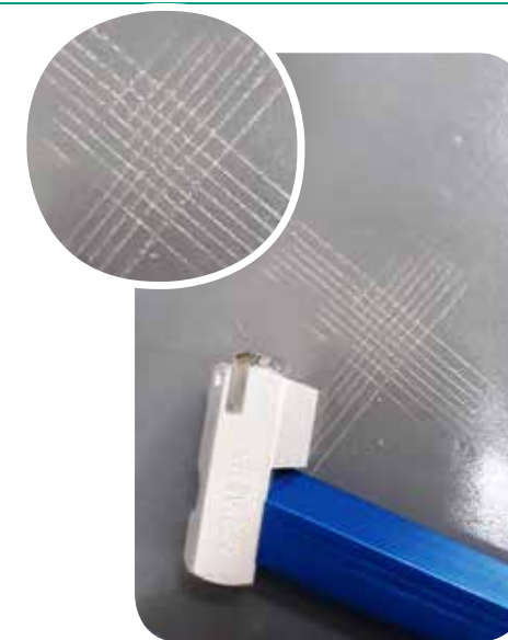
Teste de Adesão sobre chapas de aço = 0% de remoção 100% de aderência (ASTM D-3359)