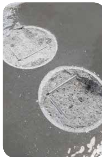
Teste de Arrancamento sobre base de concreto = 46 a 50 Kgf/cm 2 100% falha do concreto (ASTM D-4541)